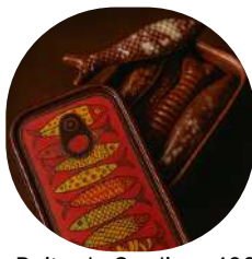
Boite de Sardines 100% Chocolat