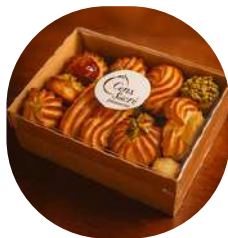
Boite de petits fours