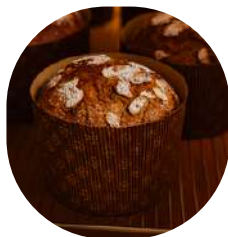
Panettone fruits confits