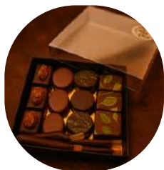
Coffret Transparent carré