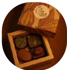
Coffret Mini (4 Chocolats)