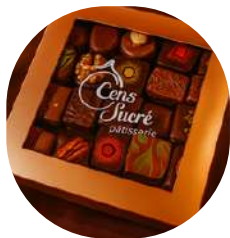
Coffret "O CENS SUCRE"