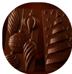
Tablette Sapin ou Boules