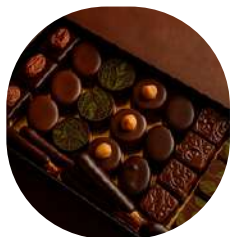
Coffret Transparent rectangle