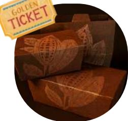
Ballotin de Chocolats