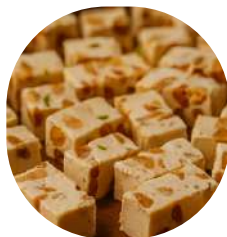
Nougats de Montélimar