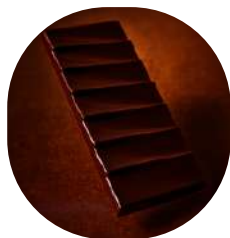
Tablette Chocolat noir